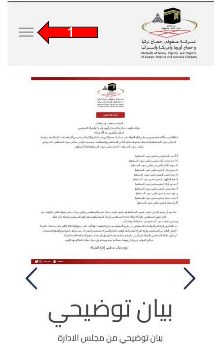
* شاشة الجوال: ١- اختيار القائمة.