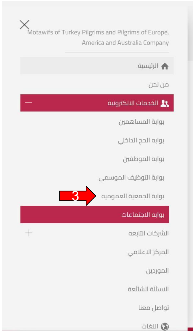
٣- اختيار بوابة الجمعية العمومية.