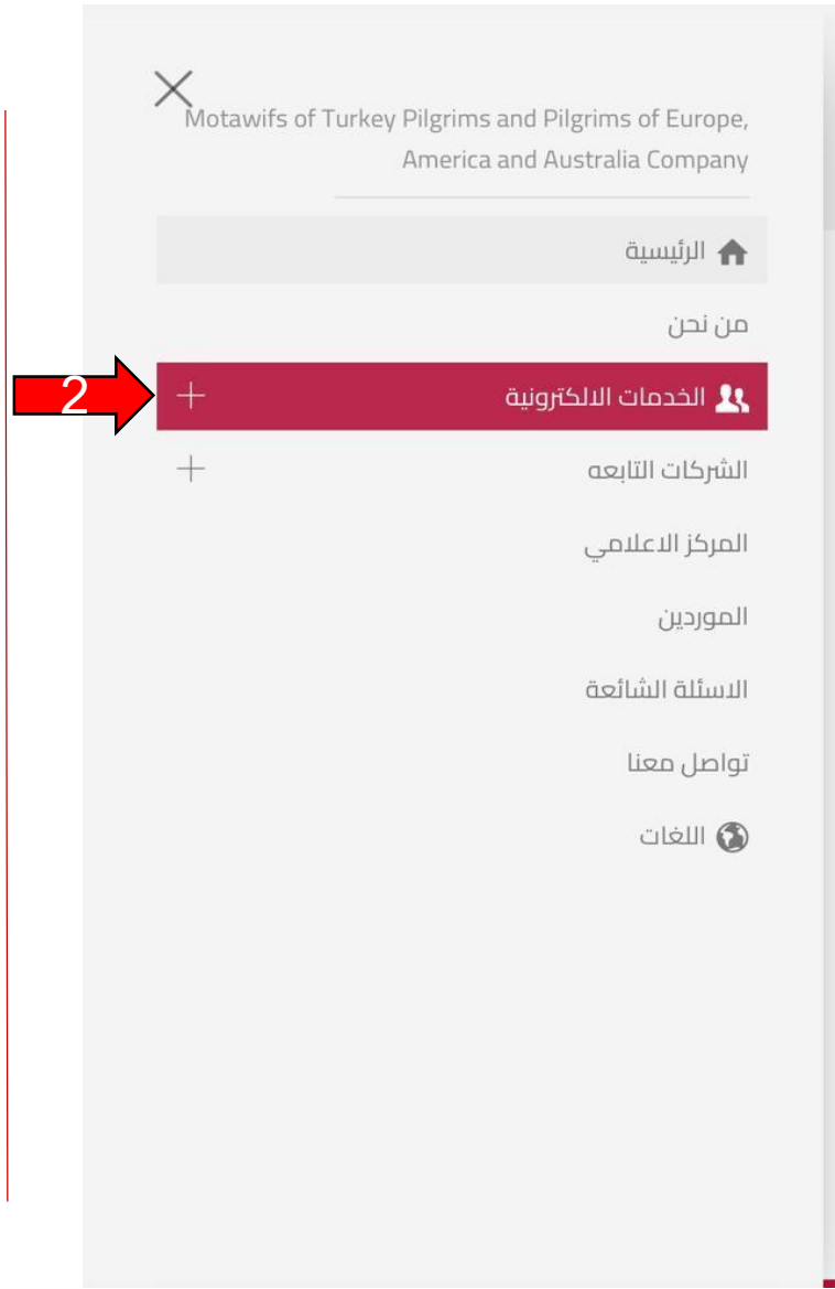
٢- اختيار الخدمات الالكترونية.